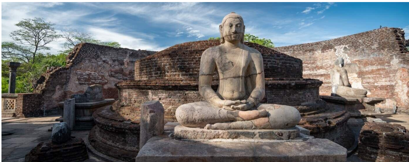
Polonnaruwa, Patrimonio UNESCO

GIORNO 6: 02/01/25 KANDY - PUSSELAWA - NUWARAELIYA - HATTON. Partenza per Kandy (sito UNESCO) in mattinata, visita della città (Tempio del Sacro Dente del Buddah). Trasferimento a Pusselawa, importante centro di produzione del tè. prosecuzione del viaggio con tappa a NuwaraEliya, conosciuta come “La Piccola Inghilterra” dello Sri Lanka. Arrivo in serata ad Hatton, capitale del thè dello Sri Lanka.